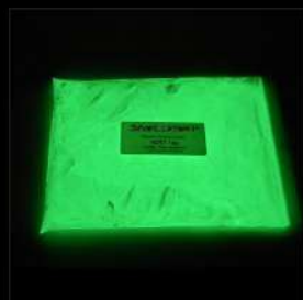
Grün Starke Leuchtdichte Lösemittel und Wasser Alle Korngrössen

Definition* : Der Ausdruck photolumineszierend umfasst allgemein alle, dank einer leuchtenden Anregung, Licht spendenden Pigmente.