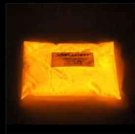
Orange schwache Leuchtdichte Ausschliesslich Lösemittel