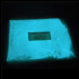
Türkis Mittlere Leuchtdichte Lösemittel und Wasser Alle Korngrössen