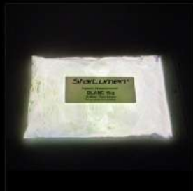
Weiss schwache Leuchtdichte Ausschliesslich Lösemittel