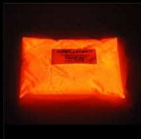
Rot schwache Leuchtdichte Ausschliesslich Lösemittel