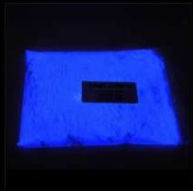
Blau schwache Leuchtdichte Lösemittel und Wasser